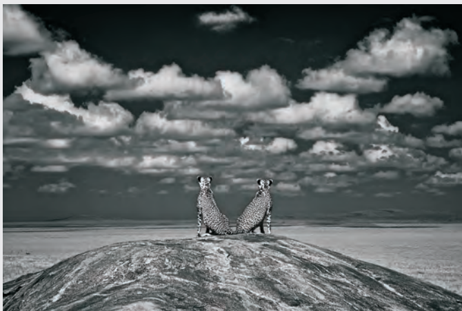
© Charlie Hamilton James (Großbritannien) Lookout for lions