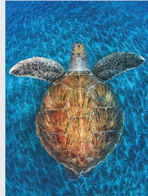
© Jordi Chias Pujol (Spanien) Turtle gem