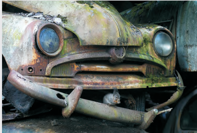
© Pal Hermanson (Norwegen) Bumper life