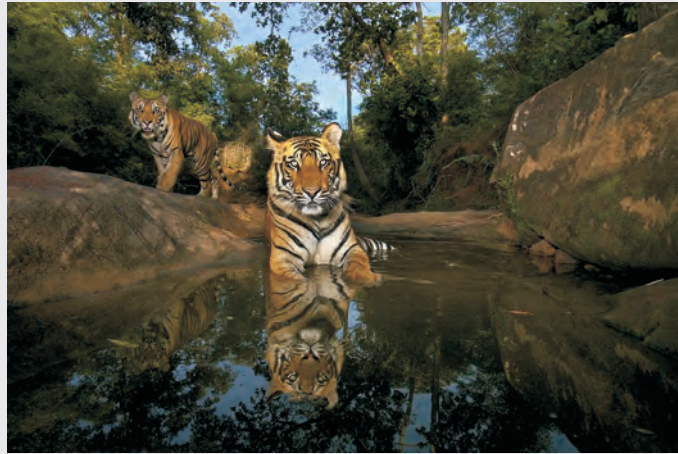
© Steve Winter (USA) Last wild picture