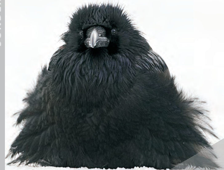
Detail ©John Marriott (Kanada) Fluff up

München, Schloss Nymphenburg www.musmn.de