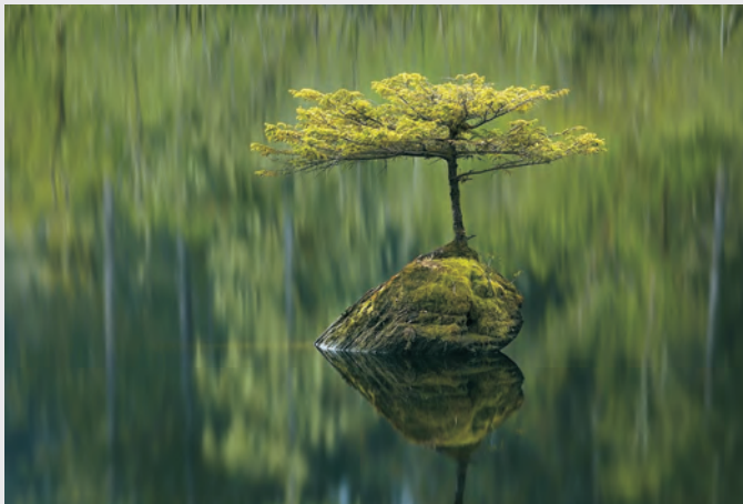
© Adam Gibbs (Kanada) Fairy lake fir